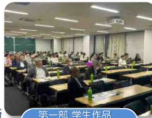
第一部 学生作品 プレゼンの様子

懇親会では学生のプレゼンに対する講評と共に、進路などの相談を受け、双方共に刺激を受ける会となりました。