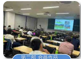
第二部 会員作品 プレゼンの様子