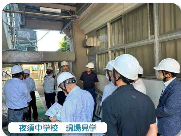
夜須中学校 現場見学