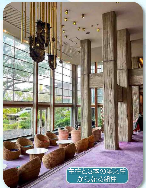
主柱と3本の添え柱 からなる組柱

エントランスを抜けると、二層吹き抜けのホールの大空間が拡がり、そして彫刻家 流政之によって作庭された日本庭園が眼前に広がっています。東光園にはこの中庭「天台の庭」のほか4階に位置する空中庭園「風の庭」、露天風呂から眺められる三つの庭など七つの庭があり「東光園の七庭」と称されています。流政之はこの本館を手掛ける以前より東光園に逗留しており、菊竹を引き合わせたと言われています。