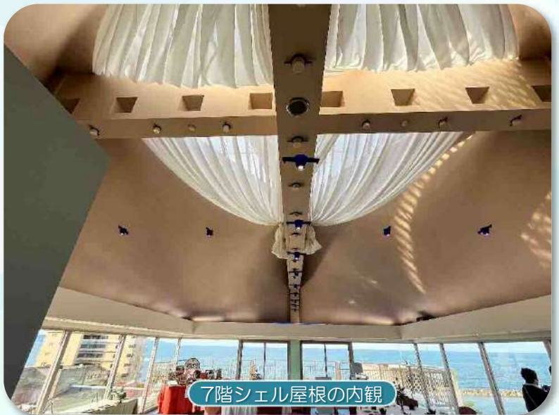
7階シェル屋根の内観