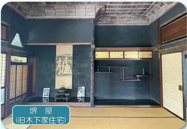
堺屋 (旧木下家住宅)